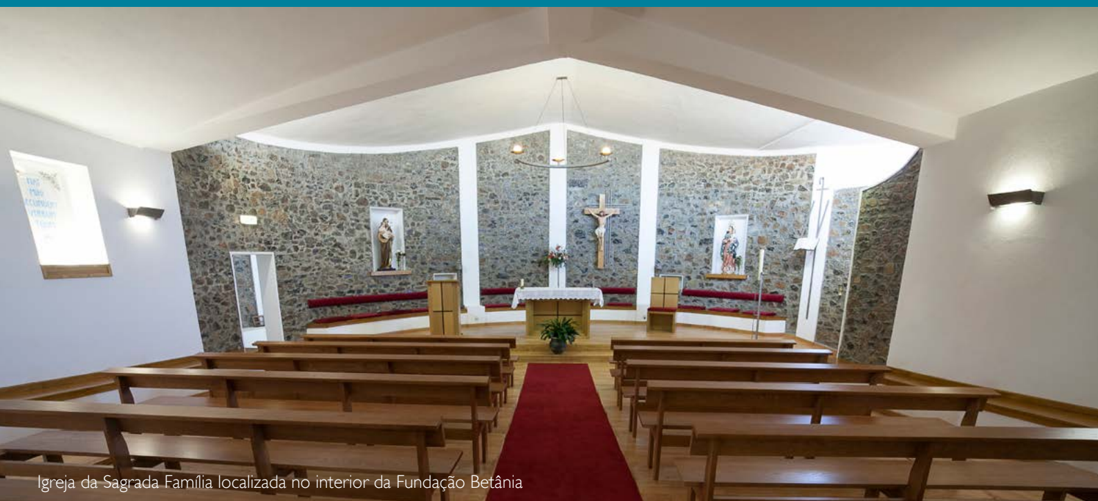
Igreja da Sagrada Família localizada no interior da Fundação Betânia

Centro Apostólico de Acolhimento e Formação