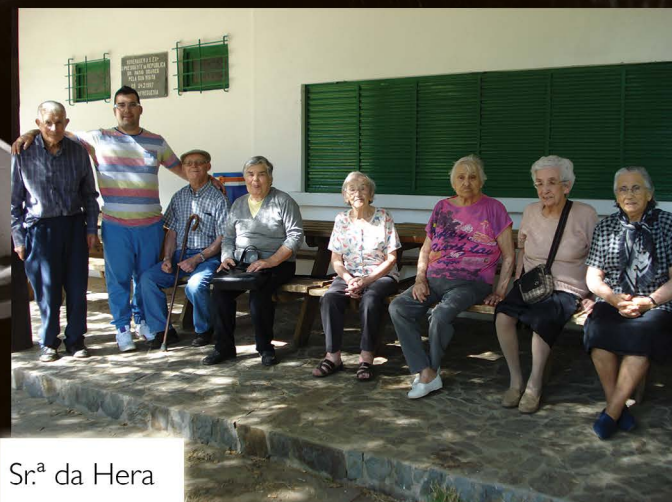
Sr. a da Hera